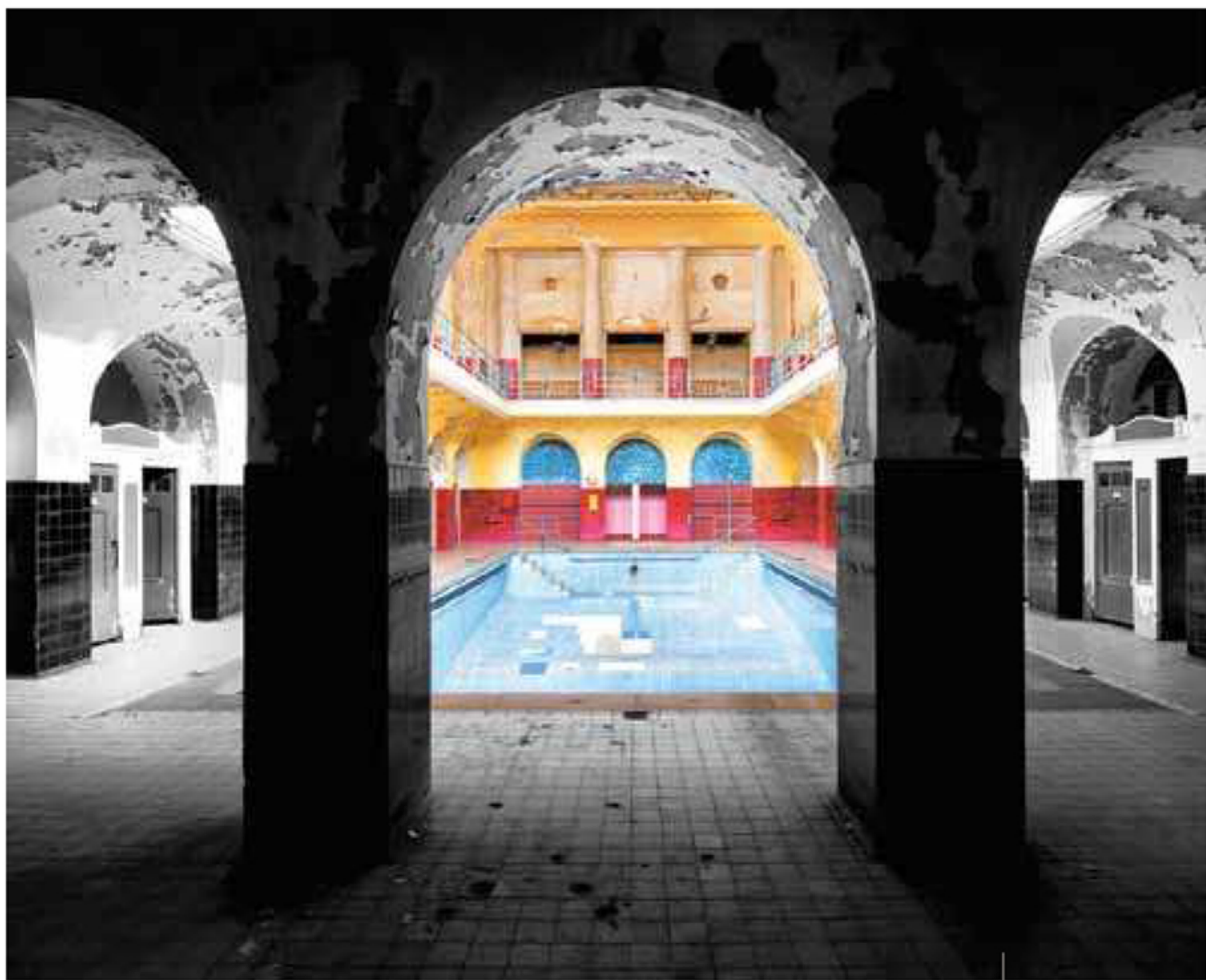
Dal ciclo "Lost places"