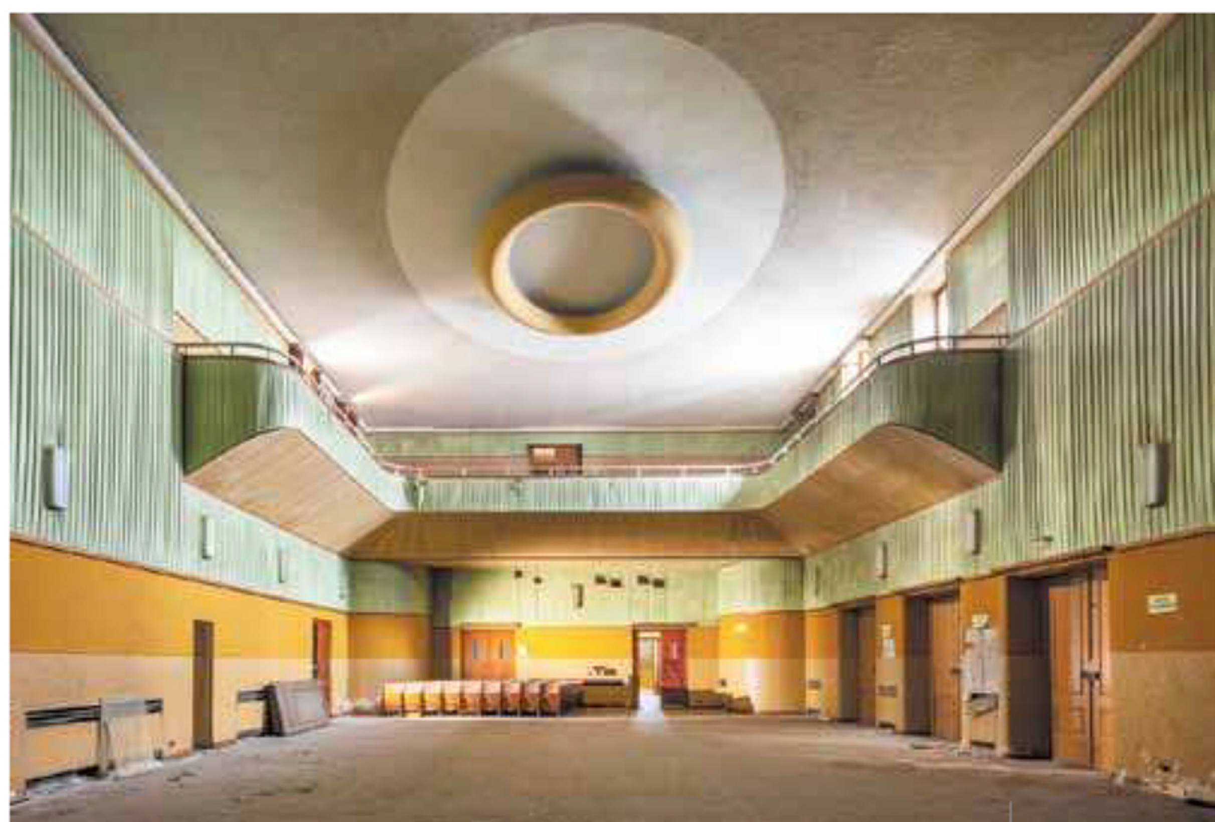
Dal ciclo "Lost places"