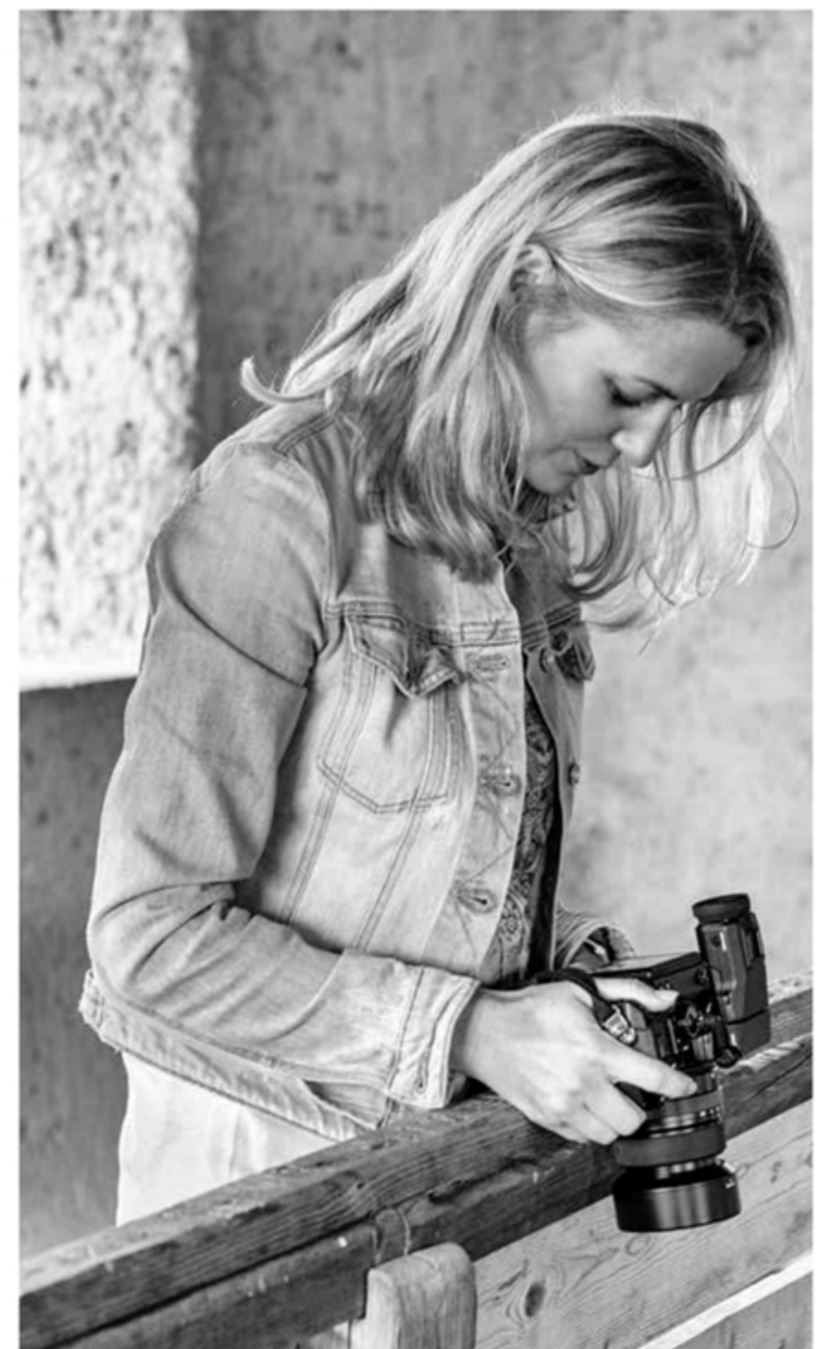
La fotografa mentre lavora