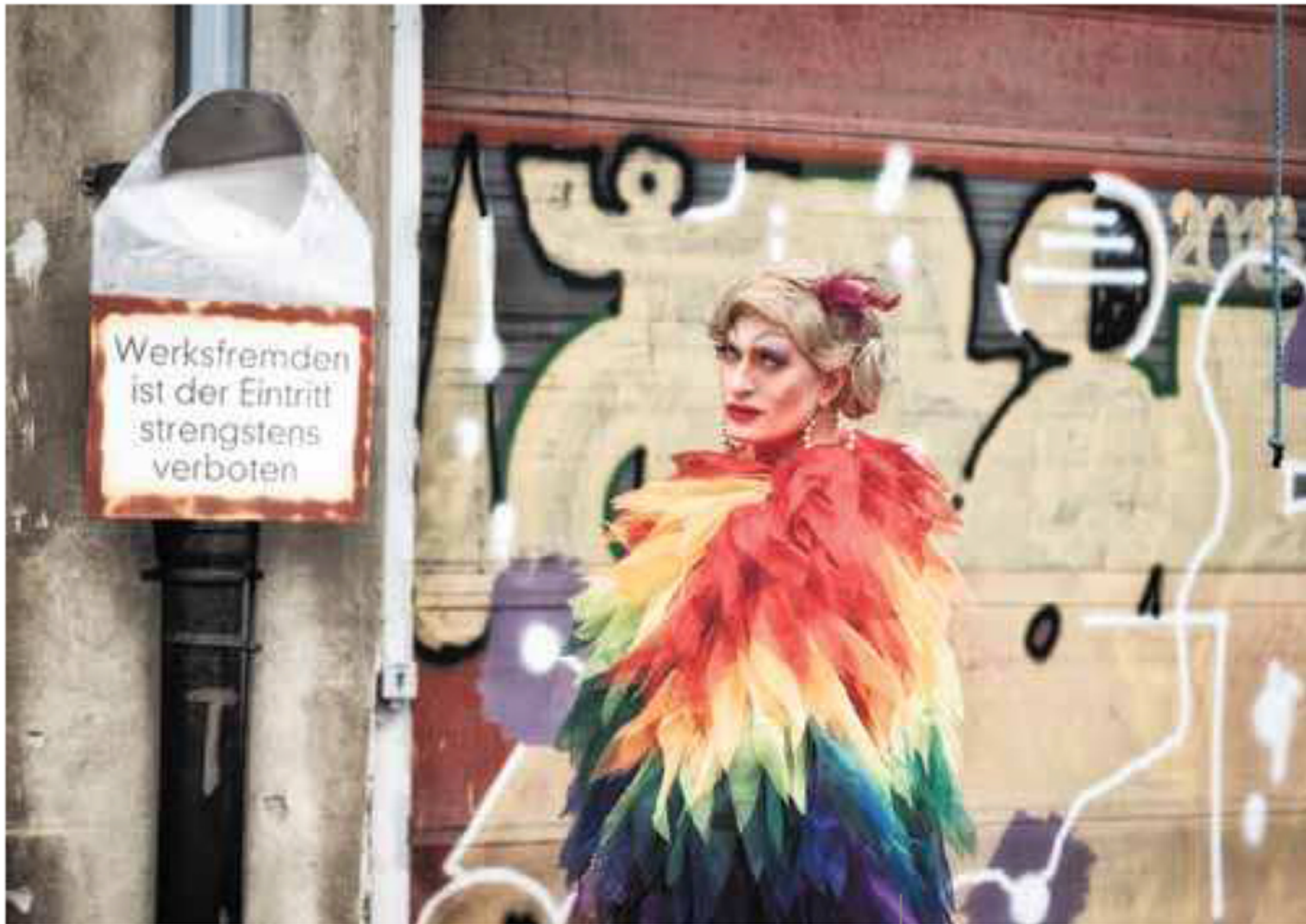
Dal ciclo "Queer Moments in Lost Places"