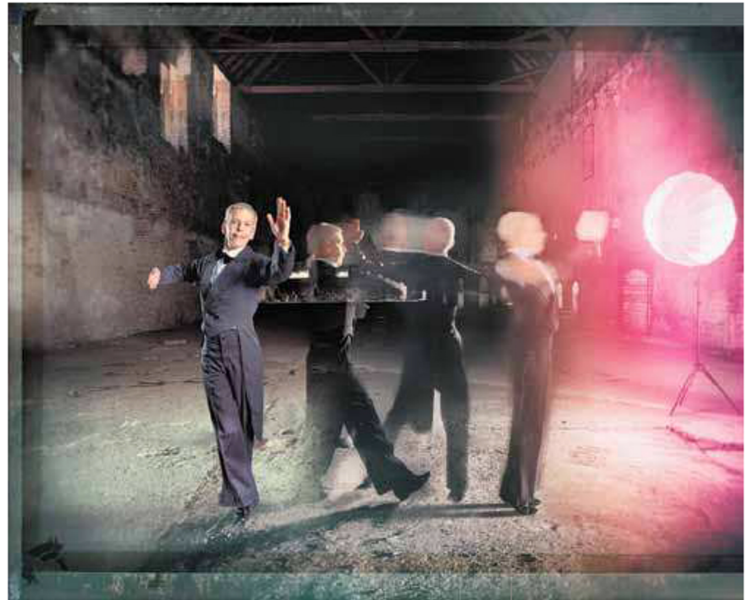
Dal ciclo "Queer Moments in Lost Places"